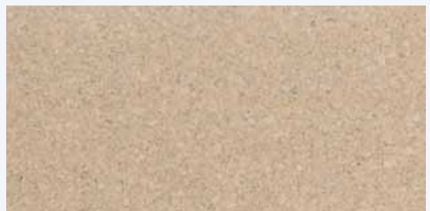
Salamanca creme, Leiste L-35c