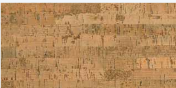
Edipo natur, Leiste L-32