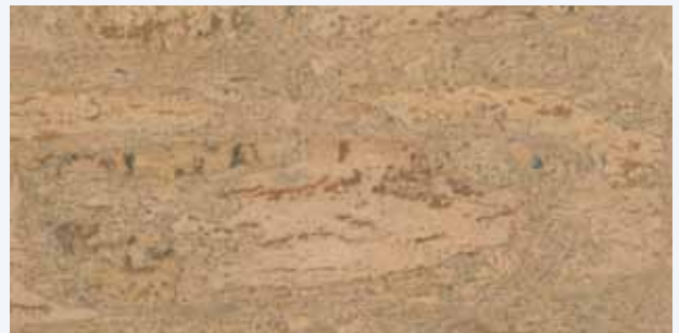
Malaga sand, Leiste L-33c