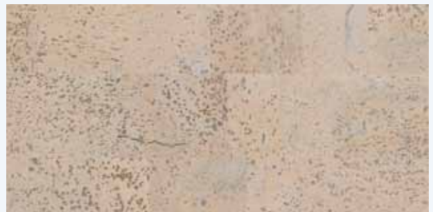
Barco creme, Leiste L-41c