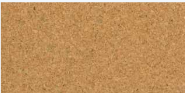
Salamanca natur, Leiste L-34