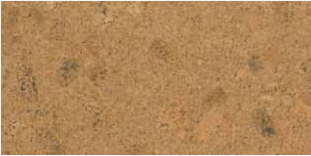
Lima natur, Leiste L-32