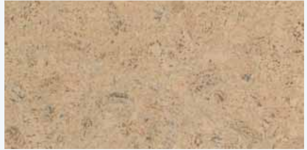
Lima creme, Leiste L-33c