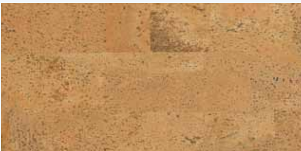
Barco natur, Leiste L-40