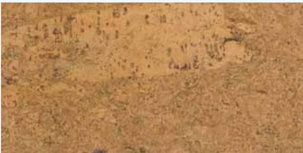
Malaga natur, Leiste L-40