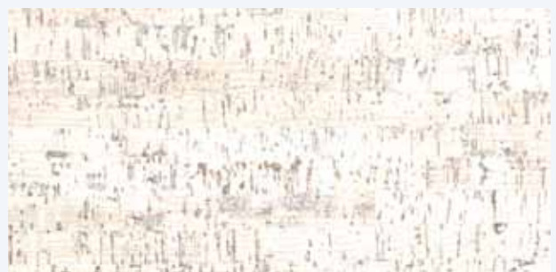
Edipo creme, Leiste L-33c