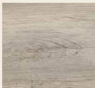
Silberfichte sägerauh Leiste: L-1150