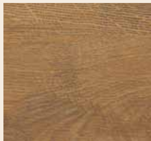
Kupferliche Leiste: L-1153