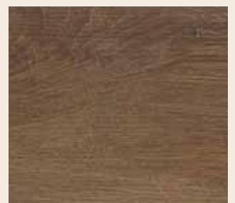
Torfeiche Leiste: L-1154