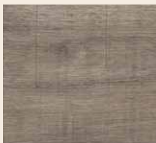
Quarzeiche Leiste: L-1152