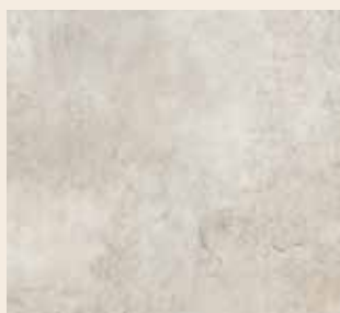
Marmor kristall Leiste: L-1156

Hochwertige Sockelleiste zur einfachen Montage mit Befestigungsclip und der Möglichkeit Kabel versteckt zu verlegen. Das digital bedruckte MDF-Trägermaterial bietet die Möglichkeit einen edlen und formschönen Abschluss des Bodendekors zu erzeugen.