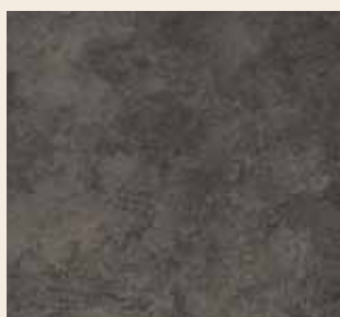
Marmor graphit Leiste: L-1155