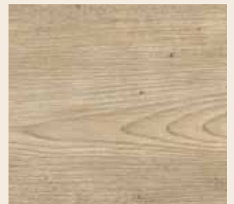
Pinie gelaugt Leiste: L-1151